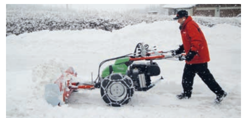
Noch mehr Leistung und Komfort bei der Räumung grosser Schneemengen dank Seitenblechen und beim Rapid Euro mit hydraulischer Schwenkvorrichtung