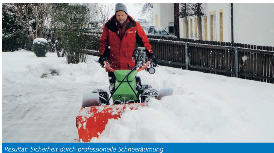
Resultat: Sicherheit durch professionelle Schneeräumung