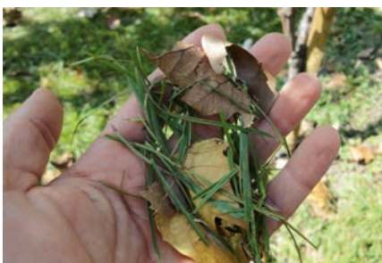
Resultat: fein gehäckseltes Mulchgut