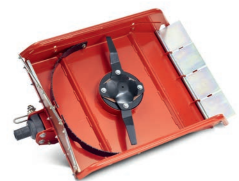
Robustes, 8 mm starkes Stahlmesser