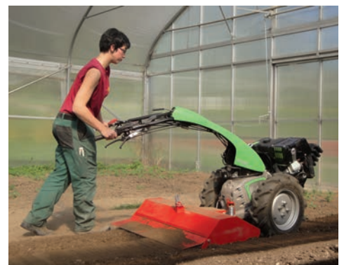
Holm seitlich verstellt

Die Verstellmöglichkeiten der Holme machen das System der Rapid Geräteträger zusammen mit den Rapid Bodenfräsen unschlagbar. Die werkzeuglos um 230° drehbaren Holme lassen sich zum Fräsen direkt hinter der Maschine wie auch nach links oder rechts zur Frässpur versetzt fixieren. Das erlaubt ein sicheres Gehen neben dem Gerät, ohne unschöne Fussabdrücke zu hinterlassen. Auch Fahrten entlang von Hindernissen wie z.B. Mauern sind so problemlos möglich. Mit der ebenfalls werkzeuglosen Höhenverstellung ist das Gerät einfach und schnell an die Körpergröße der Bedienperson oder die topografischen Verhältnisse angepasst. Das ermöglicht in jeder Situation ergonomisch perfektes und effizientes Arbeiten.