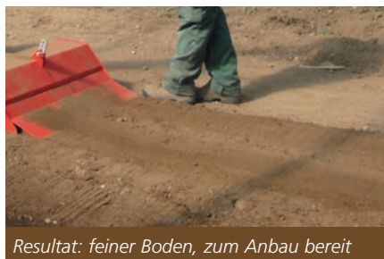
Resultat: feiner Boden, zum Anbau bereit