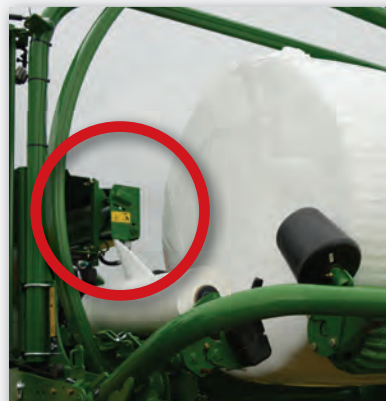
ZUVERLÄSSIGE SCHNEID- & HALTEVORRICHTUNG